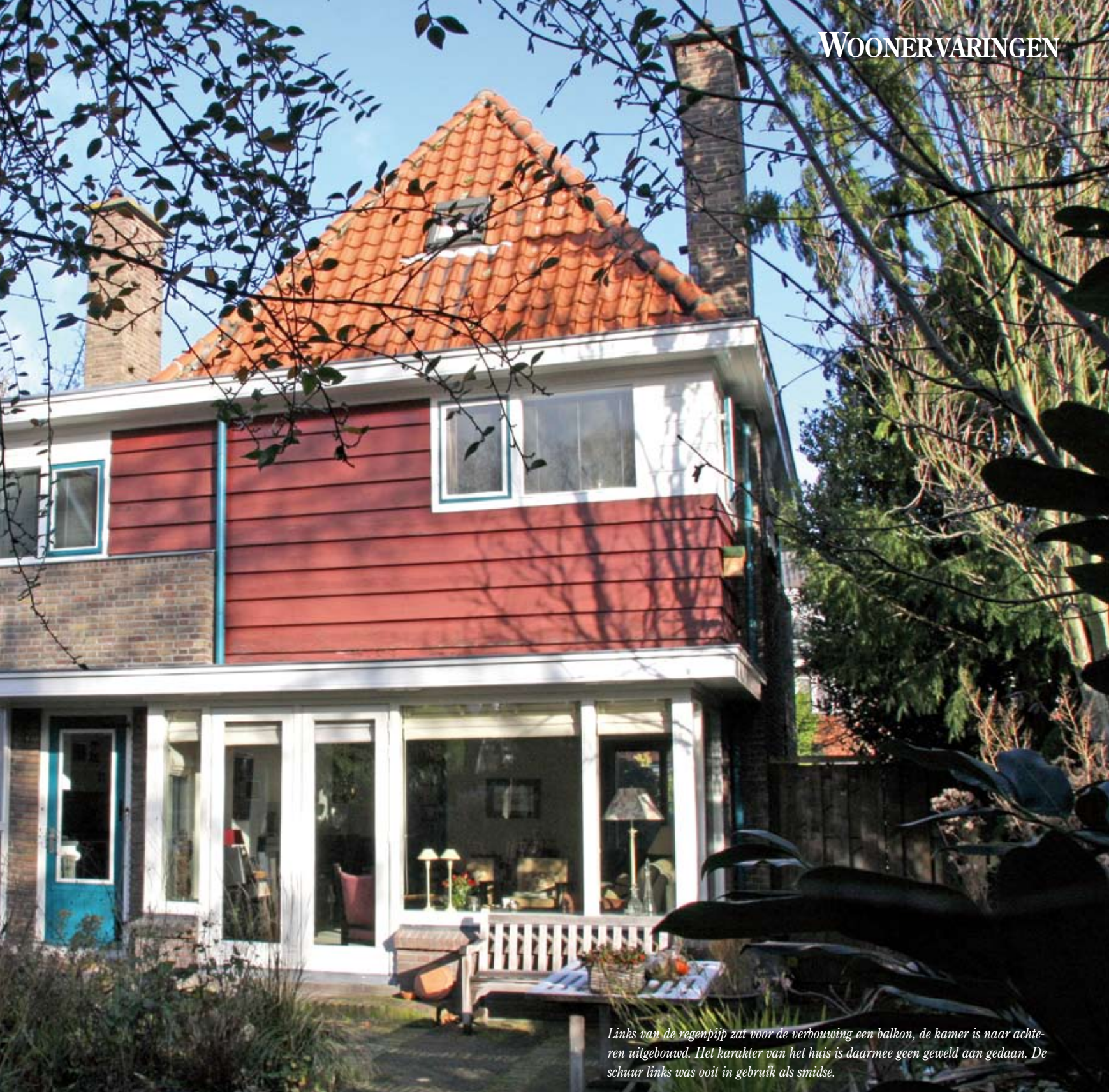
Links van de regenpijp zat voor de verbouwing een balkon, de kamer is naar achteren uitgebouwd. Het karakter van het huis is daarmee geen geweld aan gedaan. De schuur links was ooit in gebruik als smidse.

ren heeft gewoond. Aan de kamer is een meter toegevoegd, met een glaswand en twee openslaande deuren, al waren die deuren er ook al bij het oorspronkelijke ontwerp. Verder hebben we het achterbalkon opgeofferd en de muren doorgetrokken voor een extra ruime slaapkamer.'