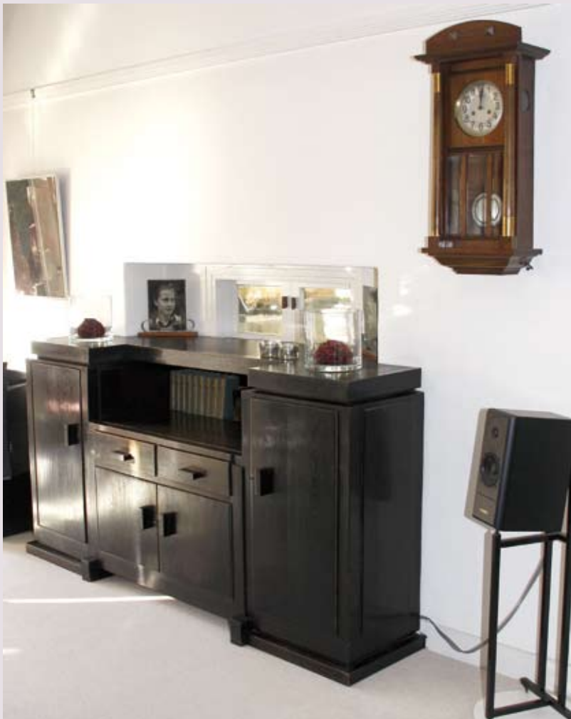
De buffetkast siert ook nog steeds de huiskamer, al is de voorkant nu geheel vlak, in tegenstelling tot de enigszins hoekige originele vorm. Het meubelstuk lijkt qua design een kleinere broer van de in de reportage over het Reigersnest getoonde buffetkast.