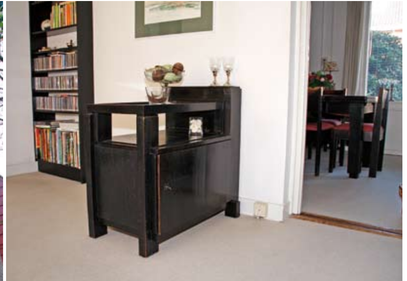
Op het hoge gedeelte van het theekastje zit een scharnierend deksel, met eronder een houder om een theedoek op te hangen. Het nut is twijfelachtig, maar leuk is het wel.