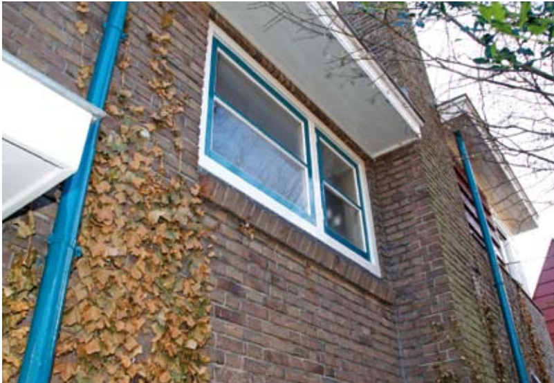
Lange rechte muurvlakken zijn voor de Amsterdamse School een gruwel, ver naar buiten stekende dakgoten en een tegen de muur geplaatste schoorsteen zorgen hier voor een speels en sterk ruimtelijk karakter.