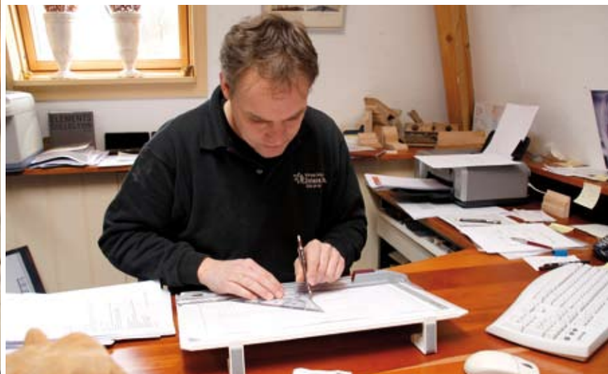
Een Zwiers keuken is alleen een Zwiers keuken als elk los onderdeel van het eigen brandmerk is voorzien.